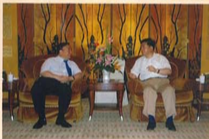
中国建材集团董事长宋志平分别与沈阳市市长李英杰（左图）、徐州市市委书记徐鸣（右图）进行亲切交